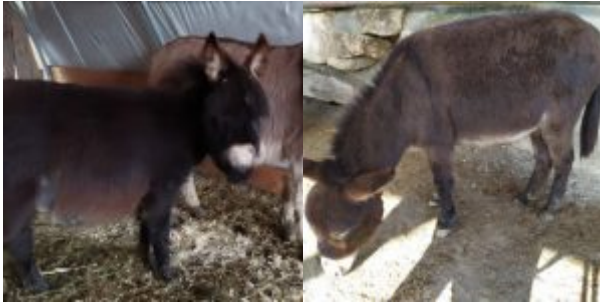
Zelie und Momo