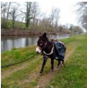
Valentine, 12 Jahre