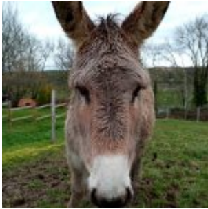
Flanelle, 5 Jahre