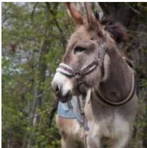
Olive, 20 Jahre