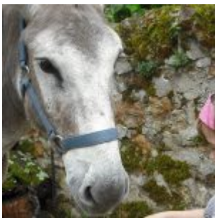
Odyssee, 20 Jahre