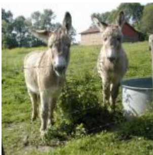
Titus & Sushi, 15 & 16 Jahre