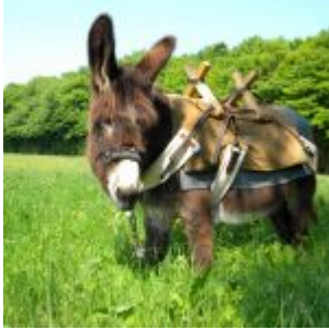
Sissi, 16 Jahre