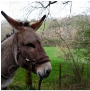
Bilbo, 9 Jahre