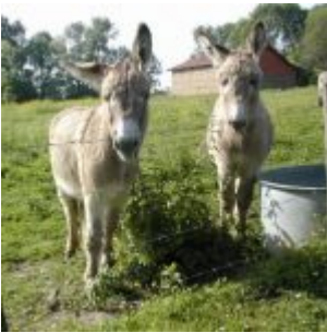
Titus & Sushi, 15 & 16 Jahre