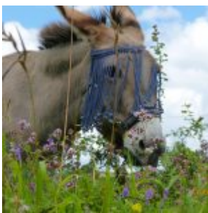
Coccinelle, 18 Jahre