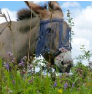
Cocinelle, 18 Jahre